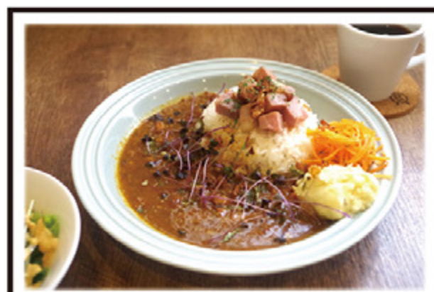
自家製ローストポークのせ